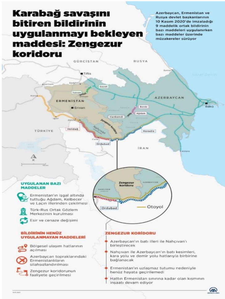
Şekil:2- Zengezur Koridoru Infografik 17

Azerbaycan ve Ermenistan arasında meydana gelen 2021 yılındaki 44 günlük savaş ve 2023 Eylül ayında Hankendi bölgesine yapılan operasyonlar neticesinde Karabağ özgürlüğüne kavuşmuş ve Azerbaycan topraklarına tam olarak katılmıştır. Bu tarihten itibaren iki ülke arasındaki normalleşme çabaları devam etmektedir. Bu çabalara Türkiye, AB, Rusya destek vermesine rağmen şu ana kadar somut bir ilerleme kaydedilmemiştir. Bu konudaki en önemli konulardan birisi Zengezur Koridoru'nun açılması konusudur. Koridor ile ilgili sayısal bilgiler aşağıda olduğu gibidir.