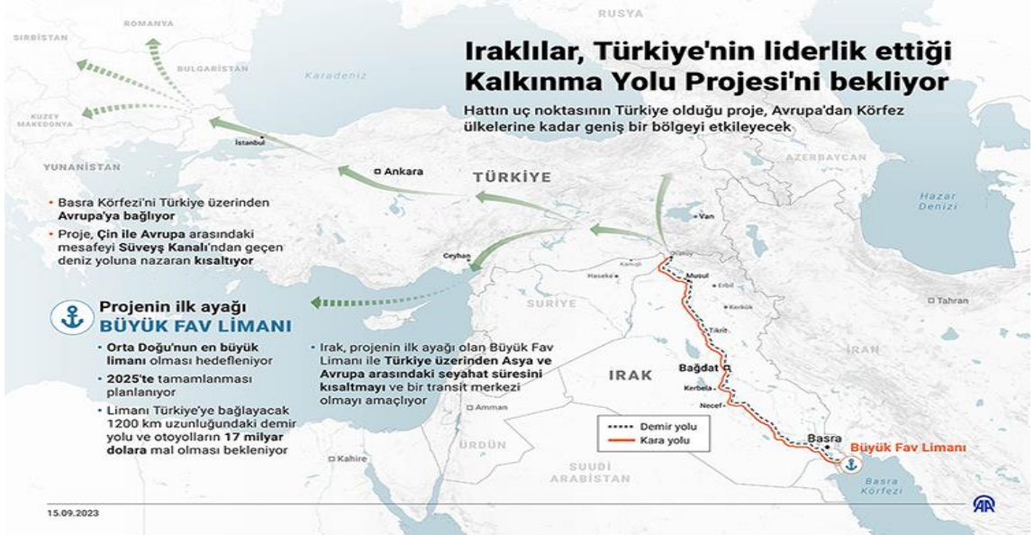
Şekil :1 Kalkınma Yolu Projesi Infografik 14

Türkiye – Irak ilişkileri belki de yıllardan sonra ilk olarak terör ve güvenlik konularının dışında önemli bir ekonomik proje ile de anılmaya başlanmıştır; Kalkınma Yolu Projesi. Mevcut durumda Basra Körfezi’ni Avrupa’ya en kısa yoldan bağlayan proje Irak’ın FAV limanından başlayarak Ovaköy sınır kapısından Türkiye içerisine girecek bir demiryolu ve otoyolunu içeren bir projedir. Proje kurucuları şimdilik Türkiye-Irak-Katar ve Birleşik Arap Emirlikleri (BAE)’den oluşsa da ileride başka ülkelerin de katılabileceği bir “Barış Yolu”na da dönüşebilir. Projenin önemli özelliklerinden birisi de halen Irak ile ticaretin kilidi durumunda bulunan Habur sınır kapısını da bypass yapmasıdır. Böylelikle proje Türkiye için ekonomik değeri yanında terör ve güvenlik boyutları ile de önemlidir. Ovaköy’den sonra demir ve otoyolları Türkiye iç hatlarını kullanarak, Mersin, İskenderun ve Kapıkule’ye oradan da tüm dünya ve Avrupa’ya ulaşabilecektir. Geline aşamada Irak’ın FAV limanı %90 oranında bitirilmiş, demiryolu ve otoyolun inşaatları için güzergah, bu güzergahlardaki emniyet konuları ile ilgili konular görüşülmektedir. Projenin geleceği açısından yıl içerisinde ilk Birinci Bakanlar Konseyi toplantısının yapılması önemli bir gelişmedir 13 .