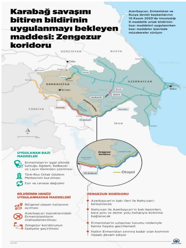
Şekil:2- Zengezur Koridoru Infografik 17

Azerbaycan ve Ermenistan arasında meydana gelen 2021 yılındaki 44 günlük savaş ve 2023 Eylül ayında Hankendi bölgesine yapılan operasyonlar neticesinde Karabağ özgürlüğüne kavuşmuş ve Azerbaycan topraklarına tam olarak katılmıştır. Bu tarihten itibaren iki ülke arasındaki normalleşme çabaları devam etmektedir. Bu çabalara Türkiye, AB, Rusya destek vermesine rağmen şu ana kadar somut bir ilerleme kaydedilmemiştir. Bu konudaki en önemli konulardan birisi Zengezur Koridoru'nun açılması konusudur. Koridor ile ilgili sayısal bilgiler aşağıda olduğu gibidir.